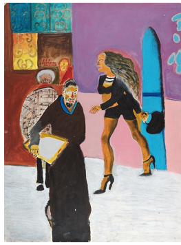
La fabrique des images - Pierre De Peet