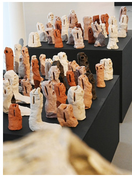
"Emportés par la foule..." - Pascal Tassini